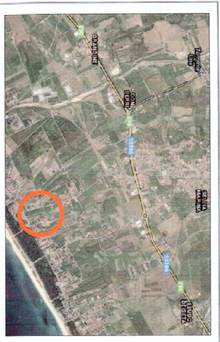
PIANO QUOTATO - STATO DI FATTO E STATO DI PROGETTO

PROGETTO: IMPIANTO PRODUTTIVO AL COPERTO TURISTICO - RESIDENZIALE - COMPLESSO UNITA' ABITATIVE PER USO STAGIONALE - SCHEDA RIF. N. 61 AT. PT