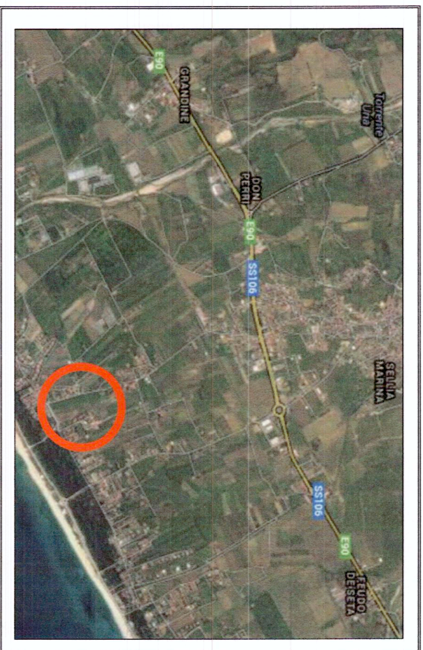
PLANIMETRIA DI LOTTIZZAZIONE E PEREQUAZIONE

PROGETTO: IMPIANTO PRODUTTIVO AL COPERTO TURISTICO - RESIDENZIALE - COMPLESSO UNITA' ABITATIVE PER USO STAGIONALE - SCHEDA RIF. N. 61 AT. PT